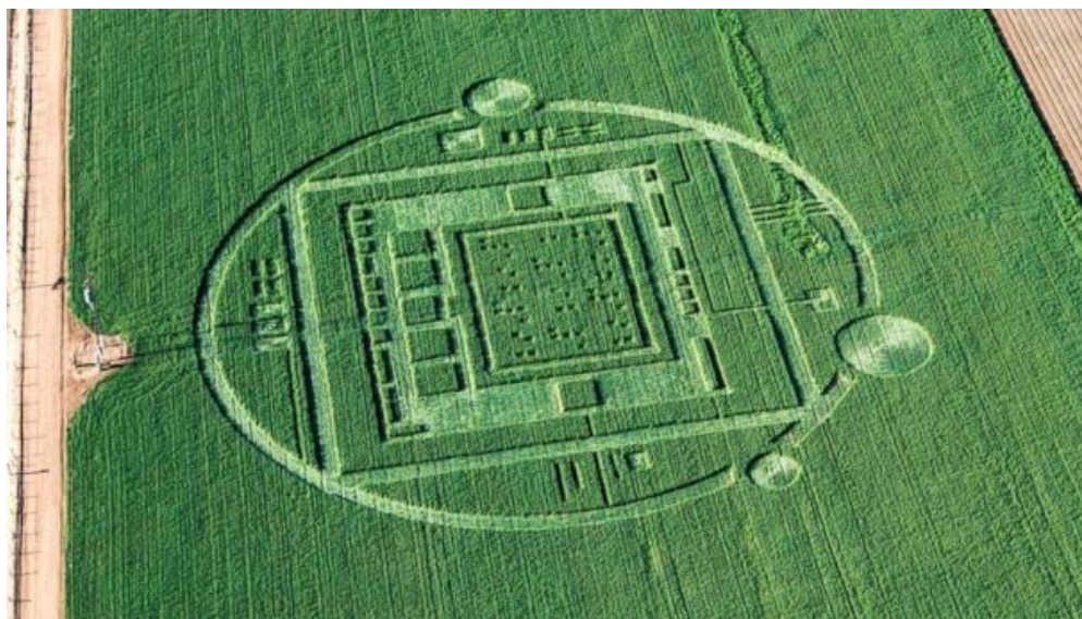
Рис 1. Фото ККП, появившегося вблизи городка Salinas (змея справа сверху – вылитая комета с хвостом). Завершение создания ККП было подсмотрено ранними папарацци: http://www.youtube.com/embed/Eoz0QUYU45o В тот же день ККП был заснят с вертолѐта: http://www.youtube.com/watch?v=z9sf93kSvHY 02.01.14 часть посевов с ККП была уничтожена: http://www.thecalifornian.com/article/20140103/NEWS01/301030025 ; ‘хозяева поля’ не справились со ‘своей подачей’ и, выбрав страусиную тактику, NeVIDIMaЙ туман напустили.

30.12.13 в Калифорнии появился Круг на Поле, в котором предлагалось направить Землю в обход сценария «трёхдневной» потравы её обитателей ядом кометы, если в срок будет решена задача, выточенная на экране монитора в центре этого ККП: