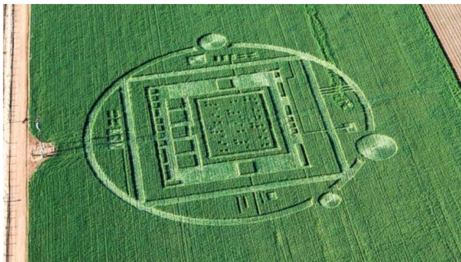
Рис 1. Фото ККП , появившегося вблизи городка Salinas (змейка справа сверху – вылитая комета с хвостом). Завершение создания ККП было подсмотрено ранними папарацци: http://www.youtube.com/embed/Eoz0QUYU45o ; в тот же день во всей своей 75м красе ККП был заснят с вертолёта: http://www.youtube.com/watch?v=z9sf93kSvHY 02.01.14 часть посевов с ККП была уничтожена: http://www.thecalifornian.com/article/20140103/NEWS01/301030025 ; ‘хозяева поля’ не справились со ‘своей подачей’ и, выбрав страусиную тактику, NeVIDIM й туман напустили.

30.12.13 в Калифорнии появился Круг на Поле , в котором предлагалось направить Землю в обход сценария «трёхдневной» потравы её обитателей ядом кометы, если своевременно будет решена задача, выточенная на экране монитора внутри квадрата из этого ККП :