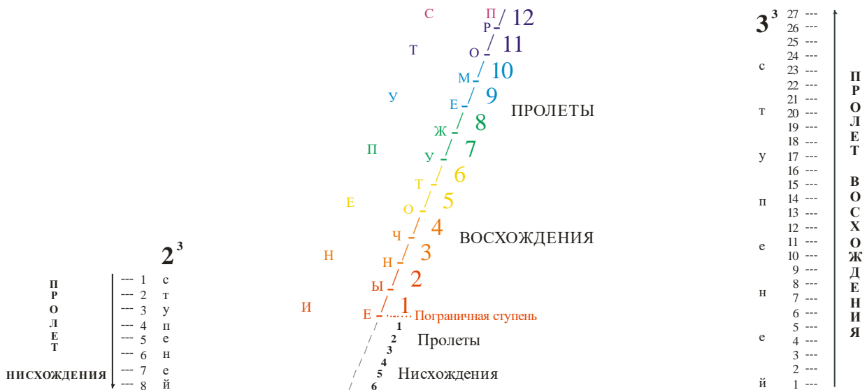
Схема 1. Лестница Иакова из 384 ступеней служит измерительной шкалой духовного развития человека.

Много осмысленней проживает отпущенный срок неофит, отслеживающий уровень духовного развития по виртуальной шкале Лестницы Иакова, тем самым внося больший вклад в копилку своего духовного рода – собственного “Отца Небесного”, молиться которому [а не коллективному Отчиму] учил* Иисус.